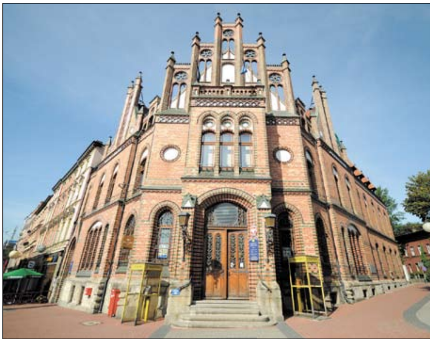
Od marca w Chorzowie Poczta Polska testuje nowe agencje.