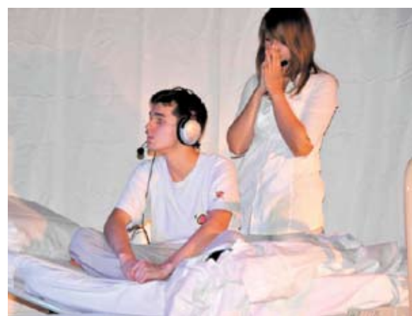
Uczniowie Zespołu Szkół Ogólnokształcących z Kluczborka zaprezentują spektakl „Oskar i Pani Róża”.

Więcej informacji na www.chorzowianin.pl