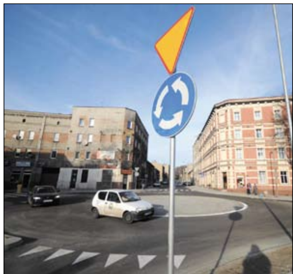
Rondo przy ul. Strzelców Bytomskich