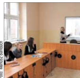
Pracownia multimedialna w AZSO nr 2