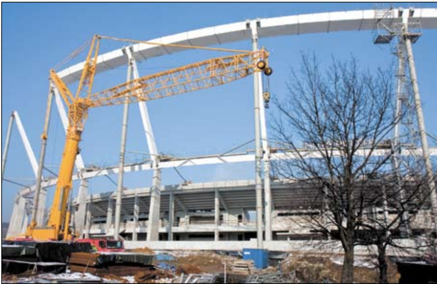
Prace związane z modernizacją Stadionu Śląskiego przebiegają zgodnie z harmonogramem.

Od 2012 roku Ruch Chorzów będzie grał na Stadionie Śląskim. O przyszłości obiektu przy ul. Cichej dyskutowali kibice, prezydent Chorzowa i członek zarządu klubu. Prace związane z modernizacją „kotła czarownic” przebiegają zgodnie z planem.