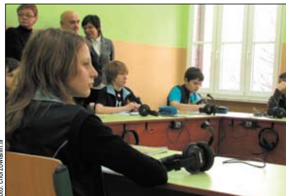
Zajęcia w pracowni multimedialnej w SP nr 32