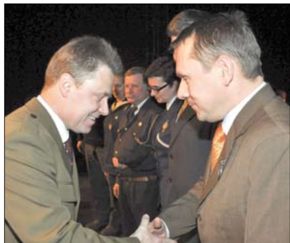
Podczas uroczystej akademii w ChCK podsumowano obchody 90-lecia ZHP Chorzów i przyznano honorowe odznaczenia ludziom związanych z harcerstwem.